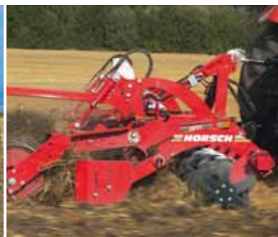
Надёжная система дисков (DiscSystem) обеспечивает оптимальное качество перемешивания и выравнивания поверхности