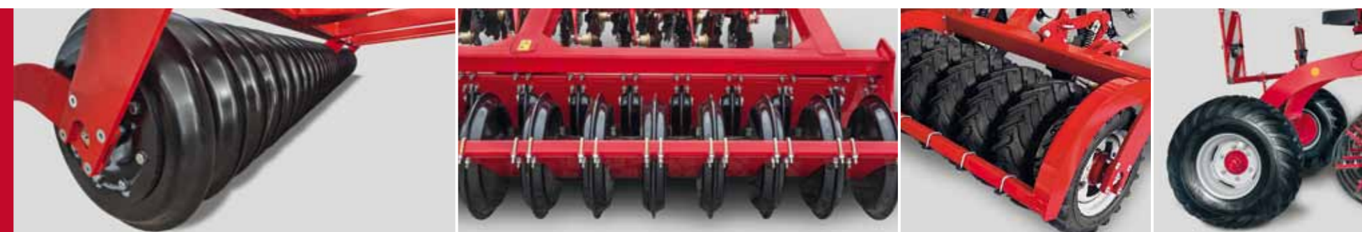
Закрытый каток SteelDisc для дополнительного крошения