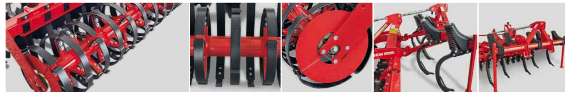
Каток RollFlex с кольцами и пластинами из пружинной стали