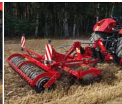
Joker/Mono TG – компактная разборная комбинация глубокорыхлителя и короткой дисковой бороны