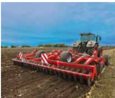
Эффективное прикатывание с измельчением грубых комьев и без образования уплотнений