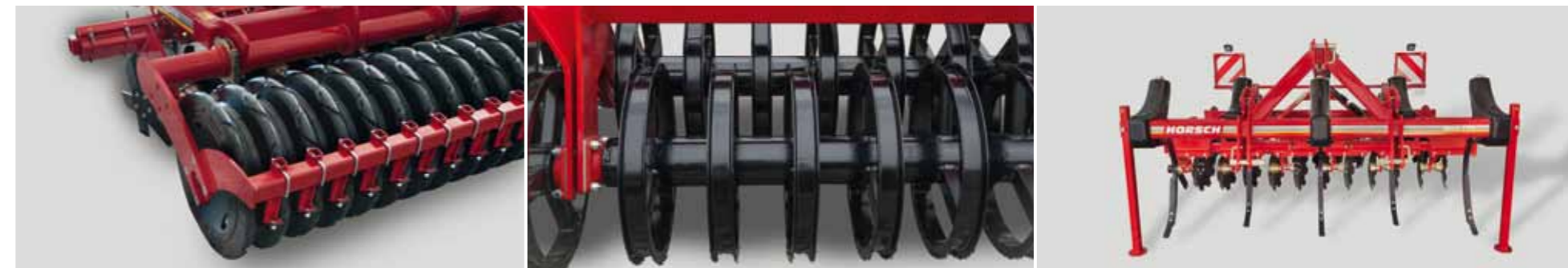
Каток FarmFlex оснащён надёжными и эффективными скребками для работы без забиваний