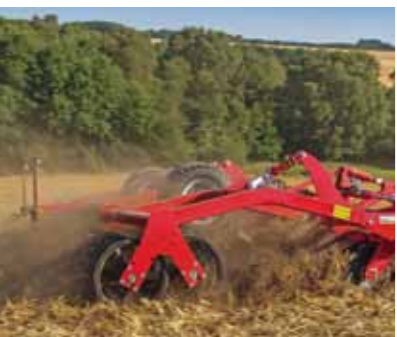
Joker создает мелкокомковатую структуру почвы и равномерно уплотненное строение обработанного слоя, что благоприятствует быстрому появлению всходов